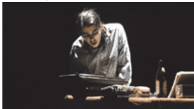
Durch die Nacht mit .... Livehörspiel mit Malhas und Keller (mehr auf S.30)

00:00 Radio Drita Kosova 01:00 Kulturpalast