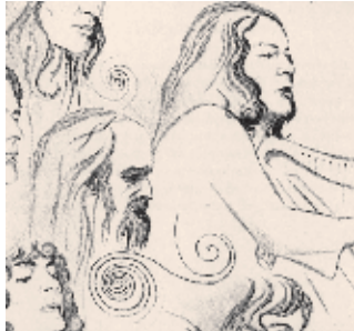
Fairport Convention, Jethro Tull, Mali- corne, Alan Stivell u.a. Am Mike E. Müller

00:00 Die Endlosdisk 06:00 Pool 08:00 Jazzfrühstück Jazz und Politik mit Egmont, Markus und amokfisch. Texte und Musiktitel auf www.amokfisch.de . 10:00 Pathos FM Pathos FM bringt die Gefühlswelt zum Wallen. 11:00 Pool 14:00 Bugwelle Revolution durch Tradition – Folkmusik in Europa