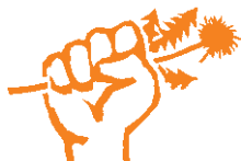
RADIO GARTENZWERG 99.2

Wie sät, erntet und pikiert man? Wann ist der Rasen zu mähen? Neben Tipps zum Garten blicken wir auch über den Heckenrand hinaus. Zum Ablauf des Gartenjahres hören Sie Geschichten, Bräuche, Rezepte und Musik.