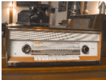
»25. Stuttgarter Filmwinter«

Kunst und Innovationen, Musik und Experimente, Gäste und Überraschungen