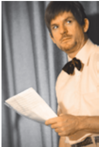
HEINZ STRUNK Spezial.