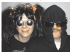
Ihr macht ja wohl eher Tanzmusik