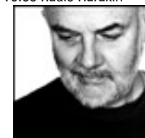
John Peel – The previously unreleased radio session!