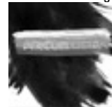
Arcon Ultra & Freundkarajan (Elektrosmog *132meter*)