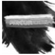
Arcon Ultra & F:R:I:E:D:E:R (Elektrosmog *132meter*)